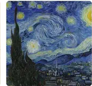
Art Movements 124 art movements