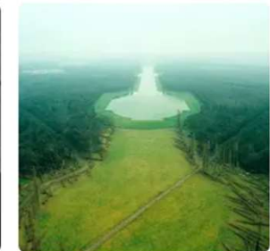
Places 17,749 places