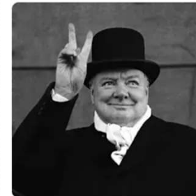
Historical Figures 9,564 historical figures