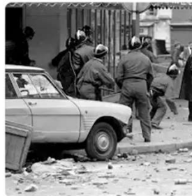
Historic Events 658 historical events