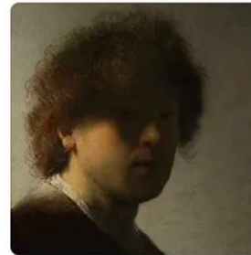
Artists 13,492 artists